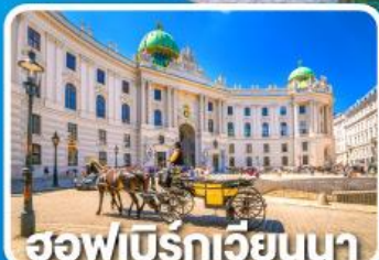
ฮอเฟอร์บรอกเวียนนา