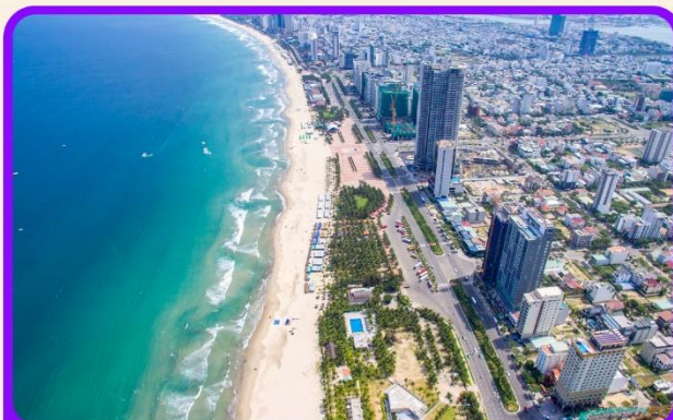
เช็किन ชายหาดหมีเคว เป็นชายหาดที่สวยงามที่สุดในเมืองดานัง