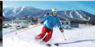
ลานสกียาปู๋ลี่

*ทางบริษัทฯ ขอสงวนสิทธิ์ในการสลับโปรแกรมทัวร์ตามความเหมาะสมขึ้นอยู่กับสถานการณ์หน้างาน โดยคำนึงถึงผลประโยชน์ของลูกค้าเป็นสำคัญ