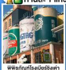
พาร์ทเนอร์เบียร์ชิงเต่า