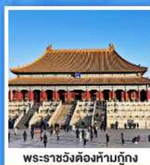
พระราชวังต้องห้ามปักกิ่ง