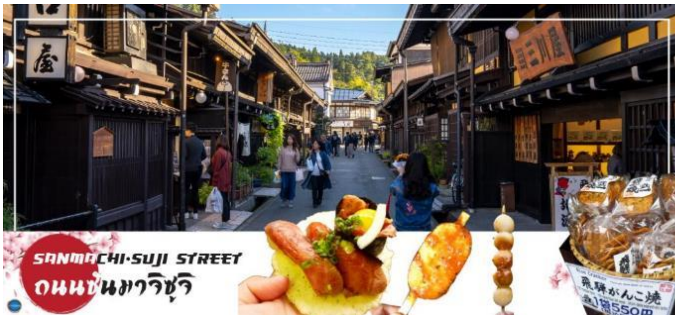
เดินทางกลับ เมืองนาโกย่า (ใช้เวลาเดินทางประมาณ 2.30 ชั่วโมง)