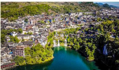
ฝูหรงเจิน