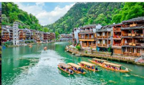
เมืองเฟิ่งหวง