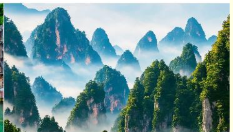
เขาเทียนช้อซาน

*ทางบริษัทฯ ขอสงวนสิทธิ์ในการสลับโปรแกรมทัวร์ตามความเหมาะสมขึ้นอยู่กับสถานการณ์หน้างาน โดยคำนึงถึงผลประโยชน์ของลูกค้าเป็นสำคัญ