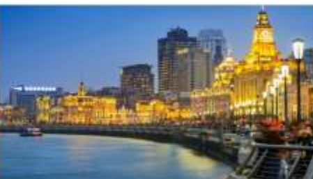
หาดไว่ทวน