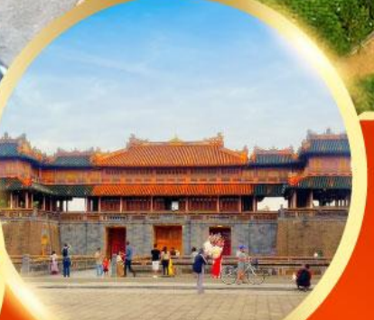
พระราชวังโบราณไดโนย