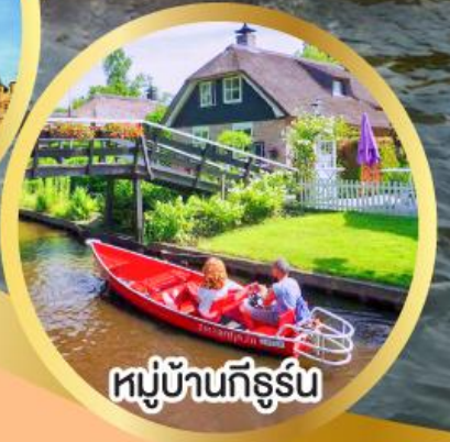
หมู่บ้านก็ธูร์น