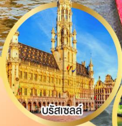
บริสเซลล์