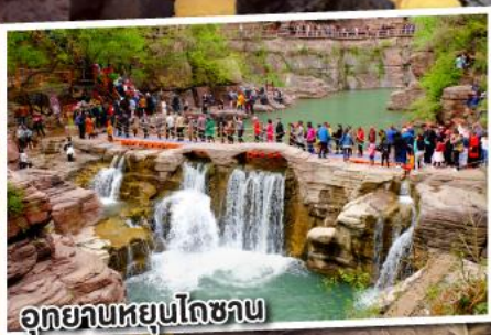
อุทยานหยุ่นโกซ่าน