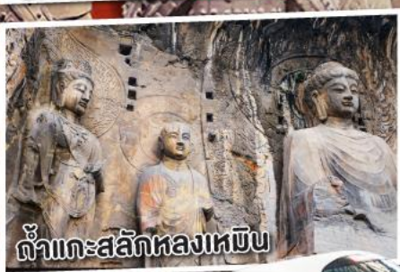
ถ้ำทะสลักหลงเหมิน