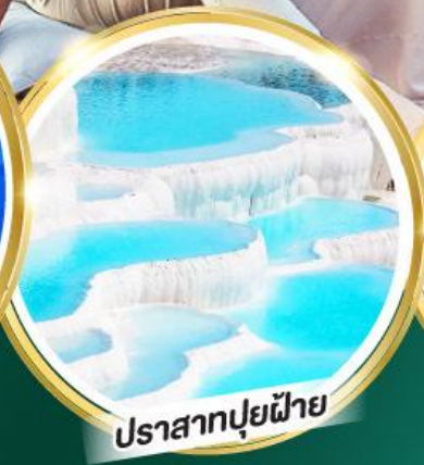
ปราสาทปูนฝ้าย