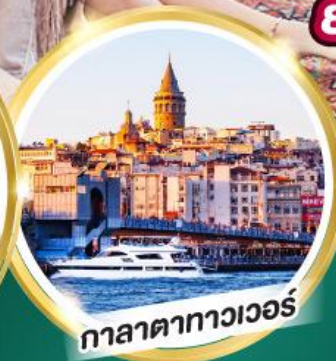
กาลาตาทาวเวอร์