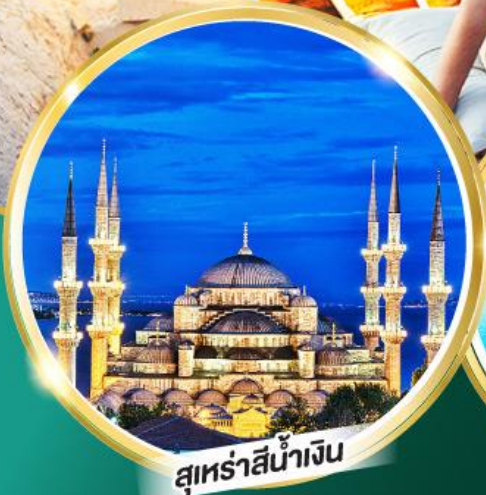
สุเหร่าสีน้ำเงิน