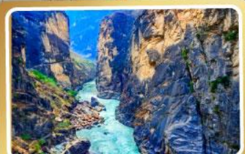
ช่องแคบเสีอกระโจน