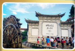
เมืองเก่าลี่เจียง