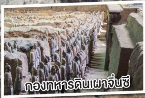
กองทัพดินเผาจิ๋นซี