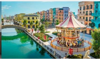
Mega Grand World