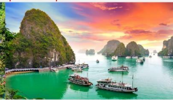
อ่าวฮาลอง

*ทางบริษัทฯ ขอสงวนสิทธิ์ในการสลับโปรแกรมทัวร์ตามความเหมาะสมขึ้นอยู่กับสถานการณ์หน้างาน โดยคำนึงถึงผลประโยชน์ของลูกค้าเป็นสำคัญ