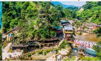
หมู่บ้านก๊ต ก๊ต