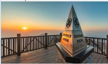
ฟานซิปัน