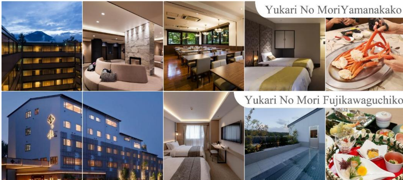
Yukari No Mori Yamanakako