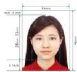
35mm x 45mm Paper Photo for Visa Application Form