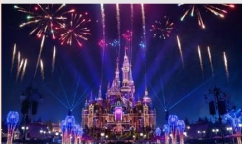
เชียงโฮ้ดิสนีย์แลนด์