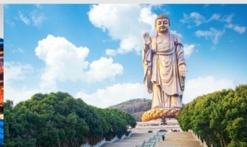
พระใหญ่หลิงชานต้าฝอ