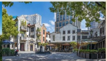
ย่านซินเทียนตี้

*ทางบริษัทฯ ขอสงวนสิทธิ์ในการสลับโปรแกรมทัวร์ตามความเหมาะสมขึ้นอยู่กับสถานการณ์หน้างาน โดยคำนึงถึงผลประโยชน์ของลูกค้าเป็นสำคัญ