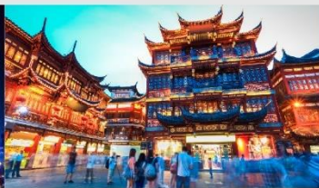
ตลาดร้อยปีเงินหวังเมี่ยว