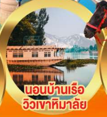
นอนบ้านเรือ วิวเจาทิมาลัย