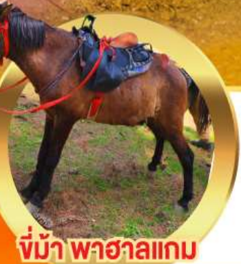
ขี่ม้า พาฮาลแกม