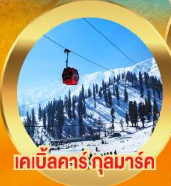
เคเบิลคาร์ คุลมารด์