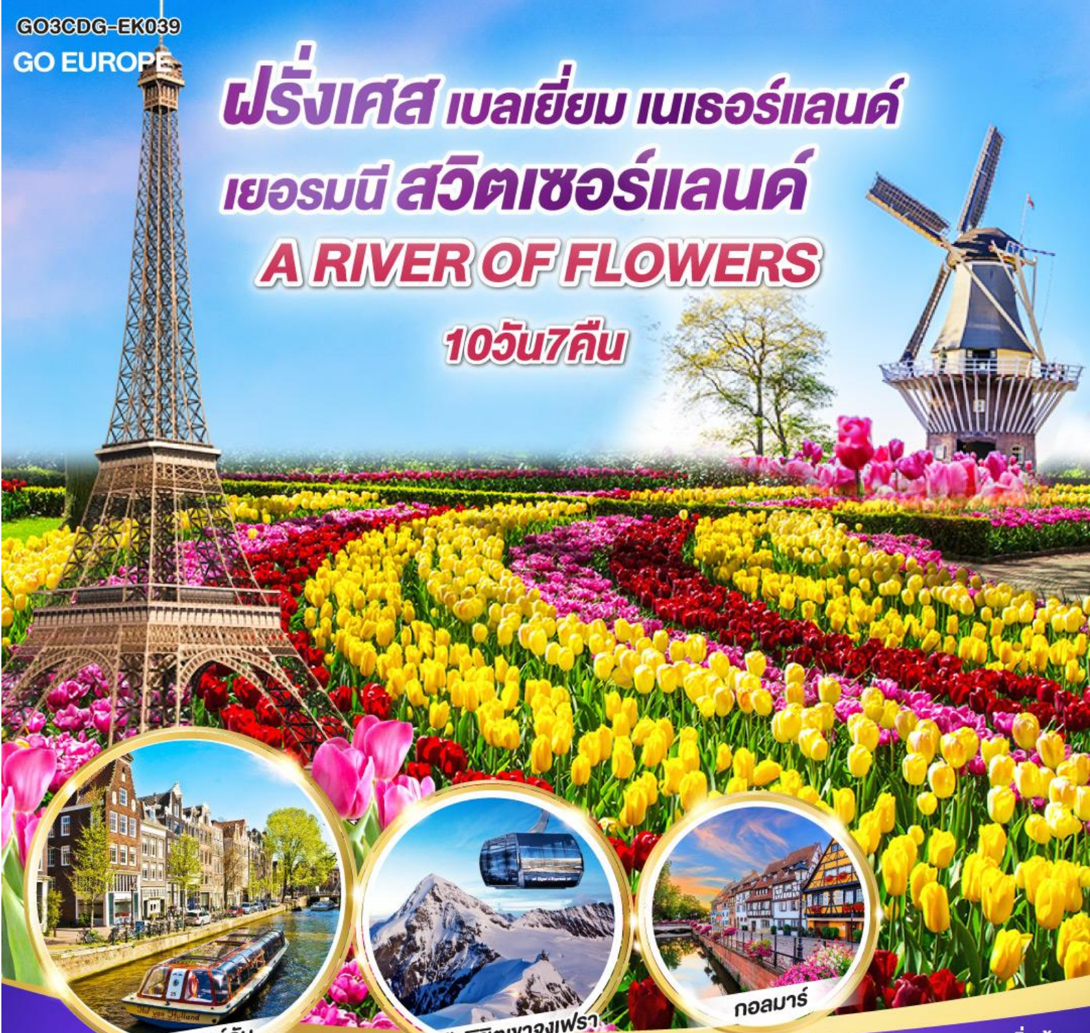
อัมสเตอร์ดัม