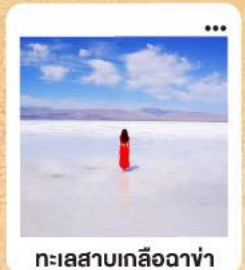
ทะเลสาบเกลือฉางซ่า