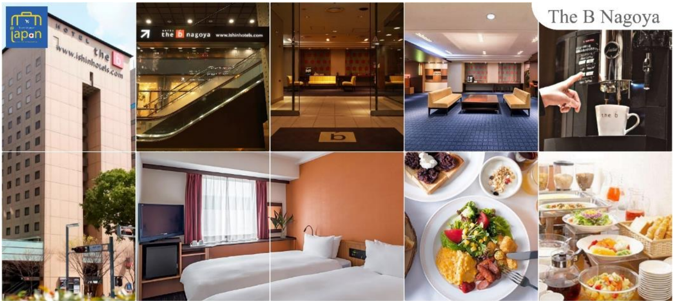
The B Nagoya

พักที่ HOTEL THE B NAGOYA หรือเทียบเท่าระดับเดียวกัน