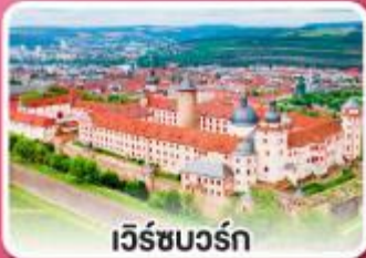
เว็รชบวร์ค