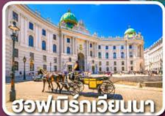
ฮอฟบิรท์เวียนนา

ตามรอยซีรีส์ Crash Landing on you ที่ทะเลสาบเบรียนซ์