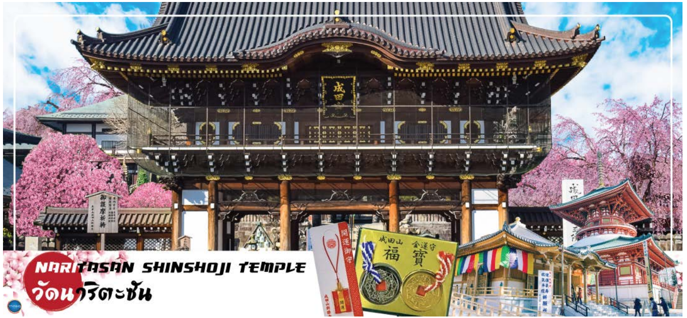
NARITASAN SHINSHOJI TEMPLE วัดนาริตะชิน

วันที่สาม เมืองนาริตะ – วัดนาริตะชิน – ถนนปลาไหล โอโมเตะซังโตะ – จังหวัดไซตามะ – ย่านเมืองเก่าคาวาโกเอะ – ศาลเจ้าฮิคาวะ – จังหวัดยามานาชิ – ออนเซ็น + ชาบูยักษ์