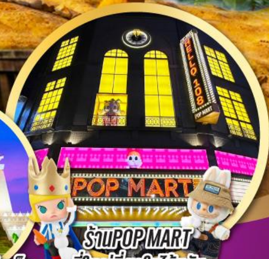
ร้าน POP MART ที่ใหญ่ที่สุดในไต้หวัน เริ่มต้น

เมนูพิเศษ!! ซาบู บุฟเฟ่ต์ ปลาประดานาโรบิต, เสี่ยวหลงเปา