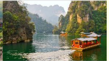
ล่องเรือเป่าเฟิ่งหู

*ทางบริษัทฯ ขอสงวนสิทธิ์ในการสลับโปรแกรมทัวร์ตามความเหมาะสมขึ้นอยู่กับสถานการณ์หน้างาน โดยคำนึงถึงผลประโยชน์ของลูกค้าเป็นสำคัญ