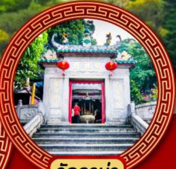
วัดอาม่า