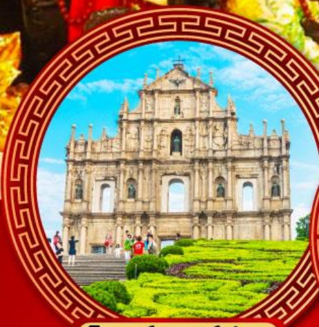
โบสถ์เซนต์ปอล