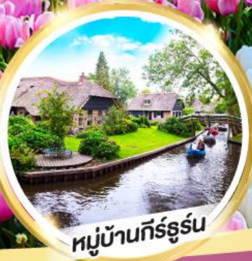
หมู่บ้านกัร์ธูร์น