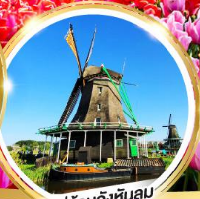
หมู่บ้านกังหันลม