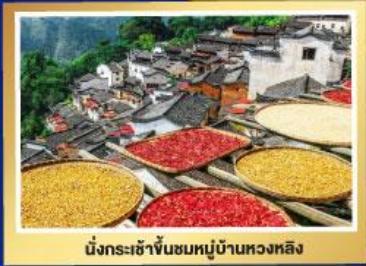
นั่งกระเช้าขึ้นชมหมู่บ้านหวงหลิง