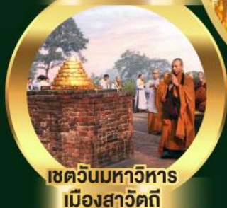
เขตวันมหาวิหาร เมืองสาวัตถี