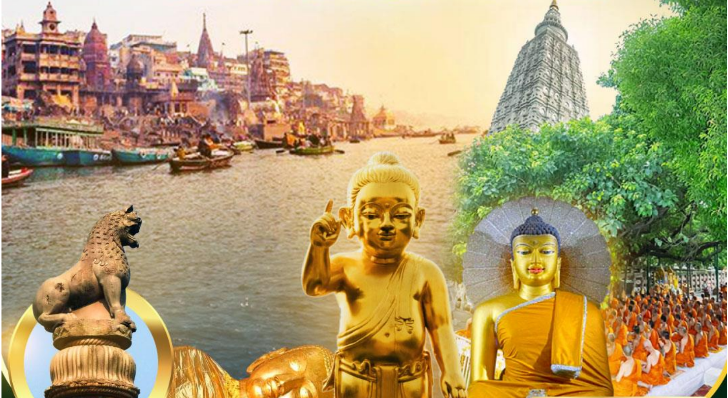
เสาอศกสิงห์ ณ เวสาลี