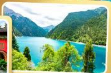
ทะเลสาบยาว