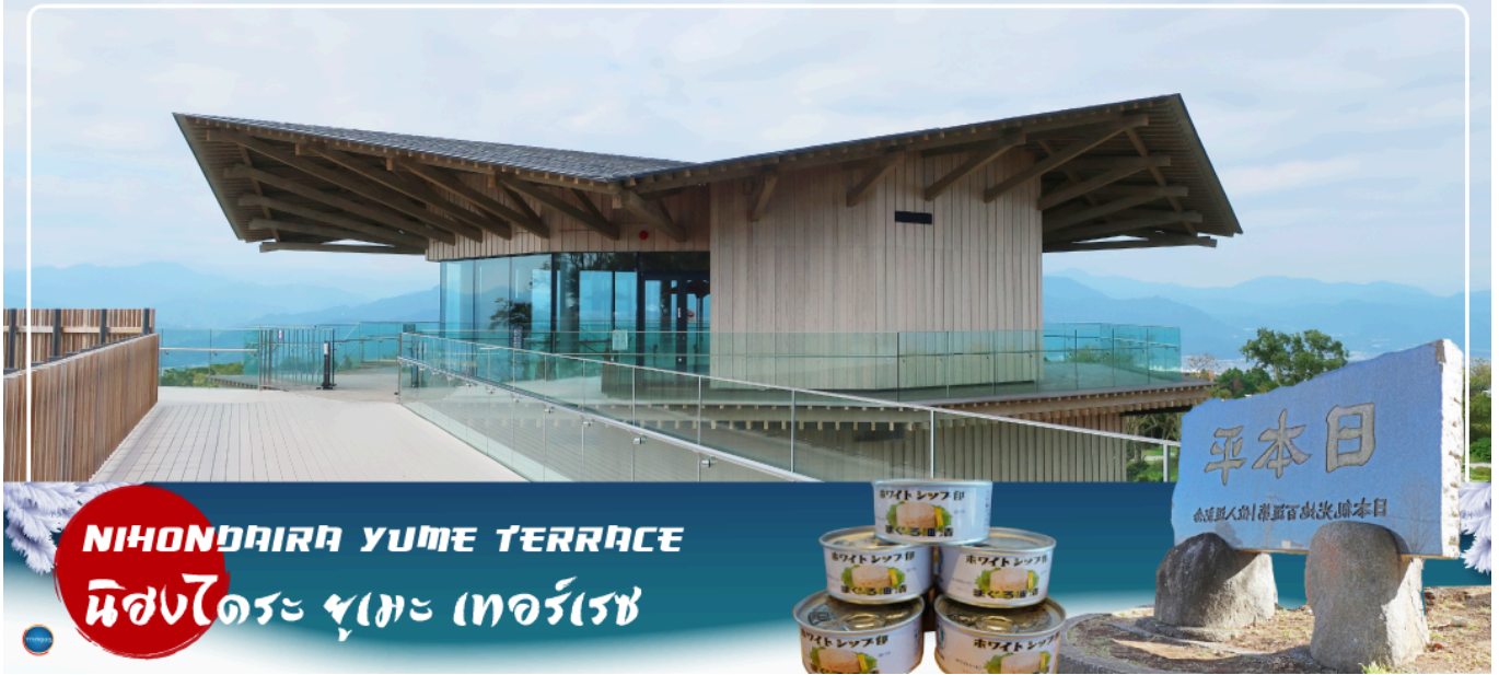
NIHONDAIRA YUME TERRACE นิสงไดระ ยูเมะ เทอร์เรซ