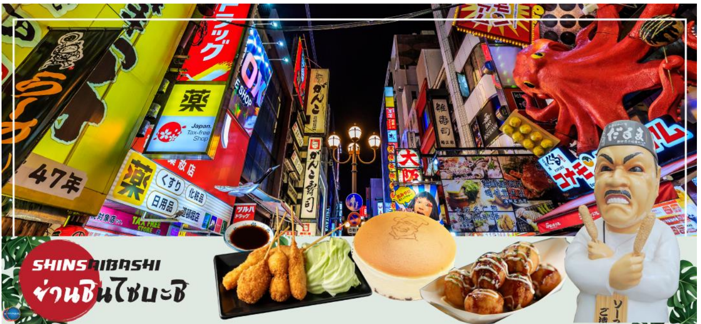
เย็น อิสระรับประทานอาหารเย็นตามอัธยาศัย

จากนั้นอิสระช้อปปิ้ง ย่านชินไซบาชิ (Shinsaibashi) (ใช้ระยะเวลาในการเดินทางประมาณ 30 นาที) บริเวณแหล่งช้อปปิ้งแห่งนี้มีความยาวประมาณ 600 เมตร เต็มไปด้วยร้านค้าปลีก ร้านแฟชั่นร้านเครื่องสำอางค์ ร้านรองเท้า กระเป๋า นาฬิกา ร้านกาแฟ ร้านอาหาร ร้านขนม ร้านเสื้อผ้าสตรีทแบรนด์ทั้งญี่ปุ่นและต่างประเทศ เช่น Zara H&M Beans ABC Mart เป็นต้น เรียกว่ามีทุกอย่างที่ต้องการรวมกันอยู่ในบริเวณนี้ ใกล้กันท่านสามารถเดินไปยัง ย่านโดทงโบริ (Dotonbori) ย่านบันเทิงยามค่ำ คินดอลอดแนวถนนเลียบบคลองโดทงโบริ จากสะพานโดทงโบริบาชิไปจนถึงสะพานนิปปอนบาชิ ไฮไลท์!!! ใครๆ ก็เชิดฉิ่ง ถ่ายภาพคู่ ป้ายกูลิโกะแมน หรือ ป้ายโดทงโบริกูลิโกะ (Dotonbori Glico Sign) เป็นป้ายไฟนีออนรูปนักกรีฑากำลังวิ่งอยู่บนลู่วิ่ง ซึ่งถูกติดตั้งมาตั้งแต่ ปี ค.ศ.1935 นอกจากนี้ยังมีอีกหนึ่งสัญลักษณ์สถานที่นัดพบกันหลง นั่นก็คือ ร้านปูคานิโดรากุ (Kani Doraku) ซึ่งมีปูยักษ์ขยับแขนและลูกตาได้อีกด้วย และห้ามพลาดสำหรับ ทาโกยากิ อาหารท้องถิ่นของชาวโอซาก้า ที่มาถึงถิ่นแล้วต้องลอง Original Taste รับรองไม่ผิดหวังแน่นอน