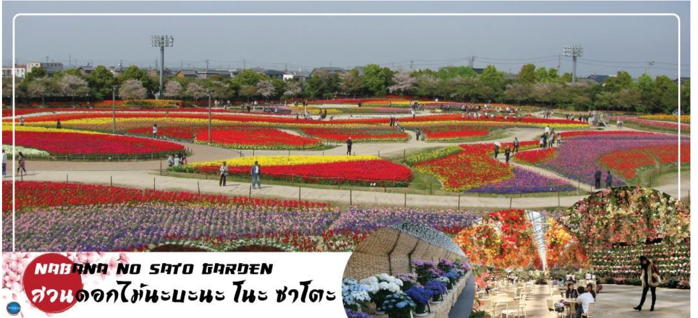
NABANA NO SAGO GARDEN สวนดอกไม้ทะเลบะนะ โนะ ซาโตะ

นำท่านสู่ เมืองซามามัตสึ (Hamamatsu) (ใช้ระยะเวลาในการเดินทางประมาณ 1.40 ชั่วโมง) เมืองเล็กๆ แห่งนี้เต็มไปด้วยความอบอุ่น เป็นเมืองต้นกำเนิดของแบรนด์เครื่องดนตรีชื่อดังอย่าง Yamaha และ Kawai เป็นแหล่งผลิตสินค้าในอุตสาหกรรมรถยนต์ระดับโลก เนื่องจากพื้นที่ติดทะเลฝั่งมหาสมุทรแปซิฟิก จึงทำให้มีแหล่งเลี้ยงปลาไหลชั้นดีที่ทะเลสาบซามานะ (Lake Hamana) ดังนั้นปลาไหลจึงกลายเป็นเมนูท้องถิ่นที่ห้ามพลาด