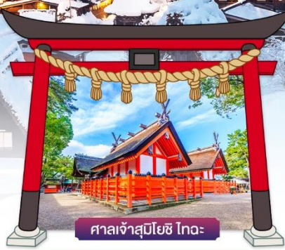
ศาลเจ้าสุมิโยชิ ไทอะ