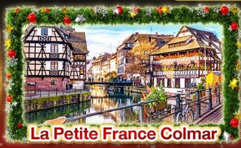
La Petite France Colmar