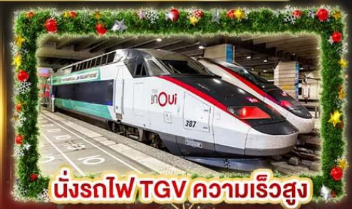
นั่งรถไฟ TGV ความเร็วสูง