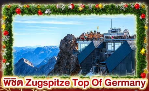
พีชิต Zugspitze Top Of Germany

🗺️ เดินทาง : 3-11 ส.ค. | 4-12 ส.ค. | 5-13 ส.ค. | 6-14 ส.ค. 68