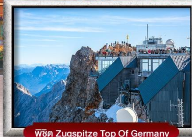
พีชิต Zugspitze Top Of Germany