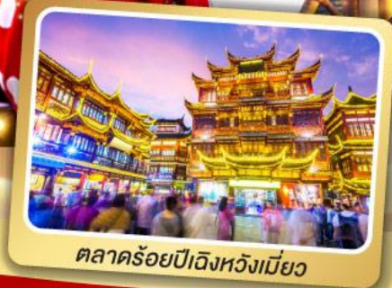
ตลาดร้อยปีฉงหวงเหมียว