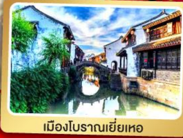
เมืองโบราณยี่เหอ