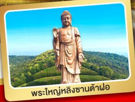
พระใหญ่หลังซานต้าฝอ