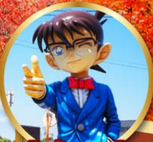
โคนันทาวน์