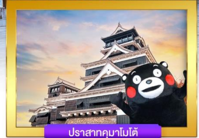
ปราสาทคามาโมโต้