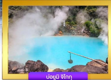
บ่อยูมิ จิโกกุ