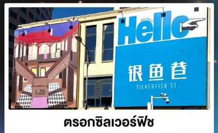
ตรอกซิลเวอร์ฟิช