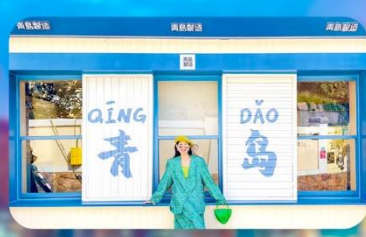
ถนนหลงเจียง