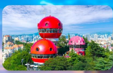
จุดชมวิว SIGNAL HILL