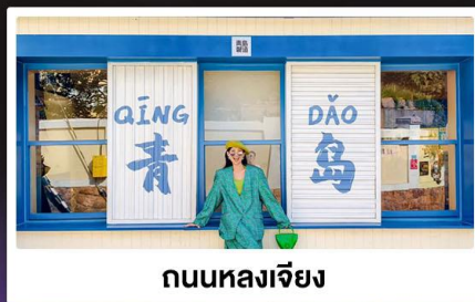
ถนนหลงเจียง