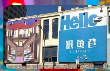
ตรอกซิลเวอร์ฟิช