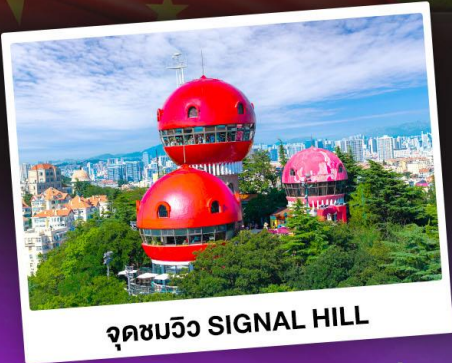
จุดชมวิว SIGNAL HILL