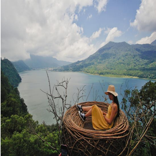
WanagiriHidden Hills Baliสำหรับกิจกรรมการถ่ายภาพ

จากนั้นนำท่านเดินทางสู่ Wanagiri Hidden hill ตั้งอยู่บนทางหลวง Munduk Wanagiri ที่มีความสูงของพื้นที่ภูเขาทางตอนเหนือของเกาะบาหลี เนินเขา และทะเลสาบที่มีความสวยงามเป็นเอกลักษณ์ แหล่งท่องเที่ยวทางธรรมชาติของ ถือเป็นกิจกรรมน่าสนใจที่ซ่อนอยู่ในบาหลี หนึ่งในนั้นคือการท่องเที่ยวทางธรรมชาติที่น่าทึ่งพร้อมเสน่ห์แห่งความงามที่เหมาะสมสำหรับการพักผ่อนและเซลฟีใน Buleleng Wanagiri Hidden Hills Bali นำเสนอจุดถ่ายรูปที่มีคอนเซ็ปต์มีเสน่ห์ของ