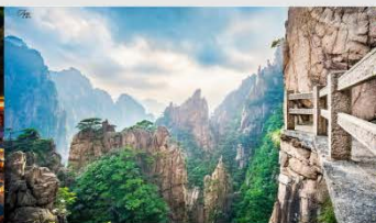
เขาหวงชาน