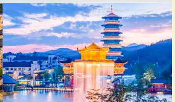
ล่องเรืออู๋หนี่โจว

*ทางบริษัทฯ ขอสงวนสิทธิ์ในการสลับโปรแกรมทัวร์ตามความเหมาะสมขึ้นอยู่กับสถานการณ์หน้างาน โดยคำนึงถึงผลประโยชน์ของลูกค้าเป็นสำคัญ