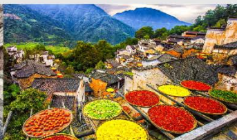
หมู่บ้านหวงหลิง