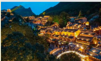
หุบเขาเทวดาวังเซียนกู่