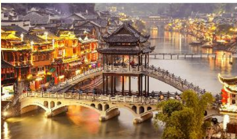
เมืองเฟิ่งหวง