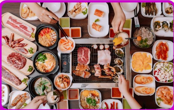
พิเศษ!! เมนูชาฮี+บุฟเฟ่ต์ปิ้งย่าง