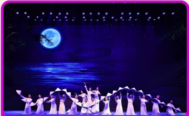
ชมการแสดง Charming Show Danang