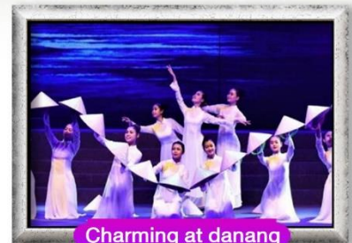
Charming at danang