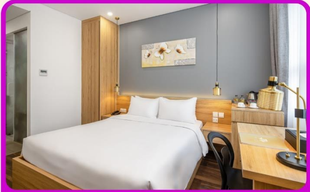
พักเมืองดานัง 4 ดาว 2 คืน