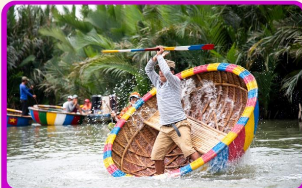
พิเศษ !!! นั่งเรือกระดัง UNSEEN เวียดนาม