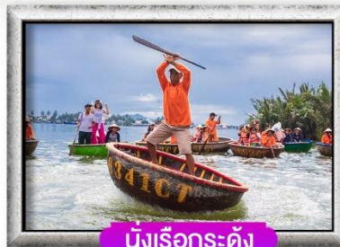
นั่งเรือกระด้าง