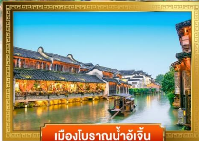
เมืองโบราณน้ำอุ๋จิ้น