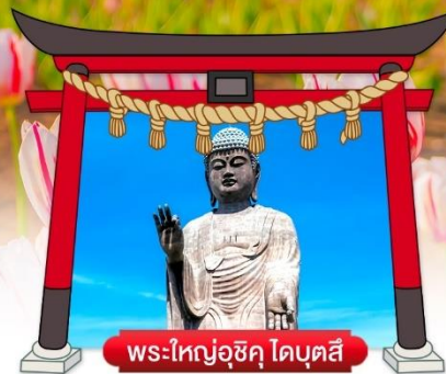
พระใหญ่อุซึคุ ไดบุตสึ