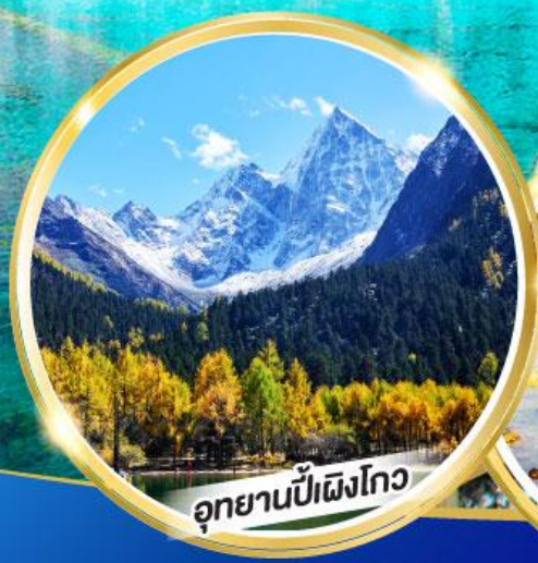
อุทยานปี้ผิงโก