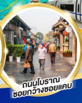
ถนนโบราณ ซอยกว้างซอยแคบ