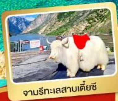
จามรีทะเลสาบเตี้ยซี