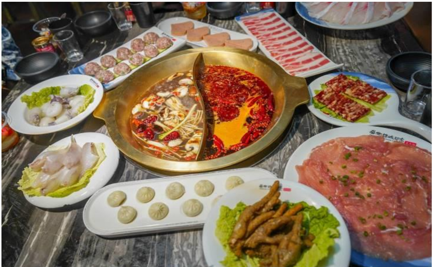
GO1TFU-MU112 เฉิงตู หวงหลง จี๋จ้ายโกว ดูหมี้แพนด้า 6วัน 5คืน โดยสายการบิน China Eastern (MU)