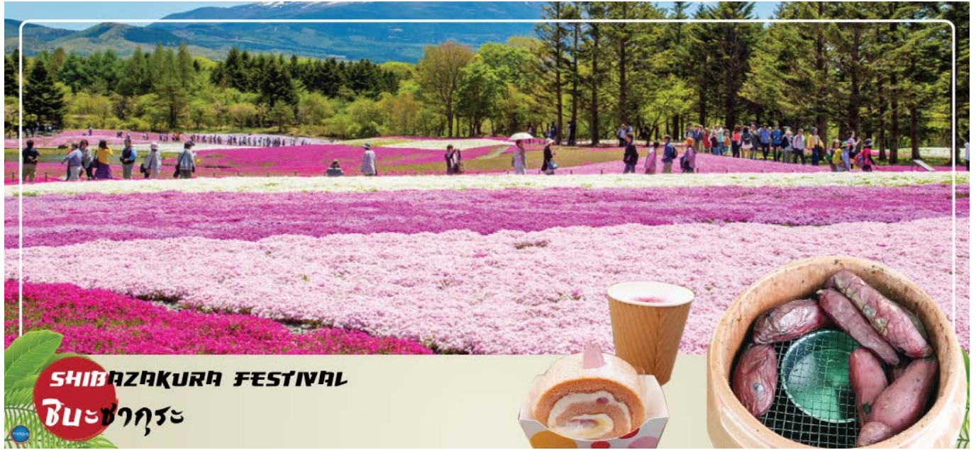
SHIBAZAKURA FESTIVAL ชิบะซากุระ

เช้า รับประทานอาหารเช้า ณ ห้องอาหารของโรงแรม (3) นำท่านเที่ยวชมเทศกาลดอกไม้ “ชิบะซากุระ” (Shibazakura Festival) (ใช้เวลาเดินทางประมาณ 50 นาที) หลังจากต้อนรับฤดูใบไม้ผลิด้วยดอกซากุระไปแล้ว ดอกไม้ที่จะมาอวดโฉมรับช่วงต่อไปนั่นก็คือ “ดอกชิบะซากุระ” หรือ “ดอกฟิงค์มอส” ที่จะผลิบานในช่วง กลางเดือนเมษายนไปจนถึงเดือนพฤษภาคม เทศกาลชมดอกชิบะซากุระ ที่คาวากูจิโกะ เมืองแห่งภูเขาไฟฟูจิ จังหวัดยามานาชิ เป็นเทศกาลหนึ่งที่มีชื่อเสียงมาก จุดเด่นของเทศกาล ชิบะซากุระ ที่คาวากูจิโกะ ก็คือวิวภูเขาไฟฟูจินั่นเอง เราจะได้เห็นทั้งภูเขาไฟฟูจิ สัญลักษณ์ของญี่ปุ่น พร้อมๆ กับดอกชิบะซากุระสีชมพูสวยหวาน ถ่ายรูปมุมไหนก็สวย และนอกจากการชมดอกไม้แล้ว ในงานยังมีจุดขายอาหารและของหวานเมนูพิเศษที่ทำขึ้นในช่วงนี้โดยเฉพาะอีกด้วย (**หมายเหตุ เทศกาล Fuji Shibazakura Festival 2024 จะจัดขึ้นในช่วงวันที่ 13เมษายน – 26 พฤษภาคม 2567) แหล่งอ้างอิง https://www.fujimotosuko-resort.jp/flower/shibazakura/index.html