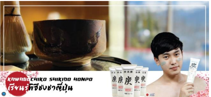
KAWADA CHIKO SHIKIJO HONPO ร้านพิธีชงชาญี่ปุ่น

นำท่านสัมผัสวัฒนธรรมดั้งเดิมของญี่ปุ่น นั่นก็คือ การเรียนรู้พิธีชงชาญี่ปุ่น (Sado) (ใช้เวลาเดินทางประมาณ 40 นาที) โดยการชงชาตามแบบญี่ปุ่นนั้น มีขั้นตอนมากมาย เริ่มตั้งแต่การชงชา การรับชา และการดื่มชา ทุกขั้นตอน นั้นล้วนมีพิธีรายละเอียดที่บรรจงและสวยงามเป็นอย่างมาก พิธีชงชา นี้ไม่ใช่แค่รับชมอย่างเดียว ยังเปิดโอกาสให้ท่านได้มีส่วนร่วมในพิธีการชงชานี้อีกด้วย และให้ท่านได้อิสระเลือกซื้อของที่ระลึกตามอัธยาศัย