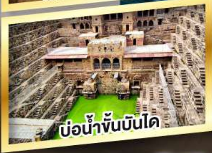
บ่อน้ำขั้นบันได