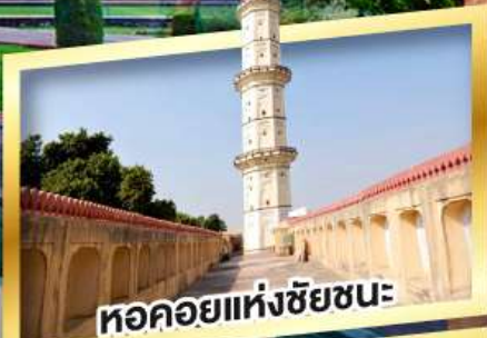
หอคอยแห่งชัยชนะ