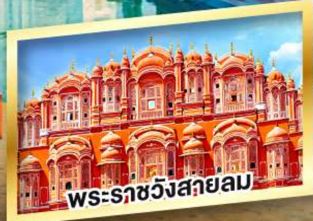
พระราชวังสลายลม