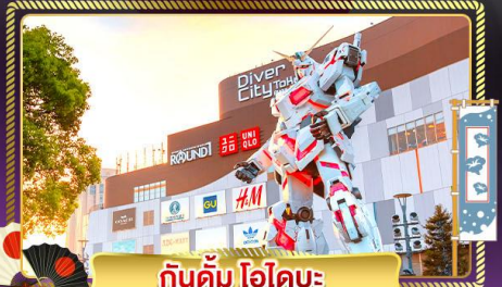
กันดั้ม ไอโตะ