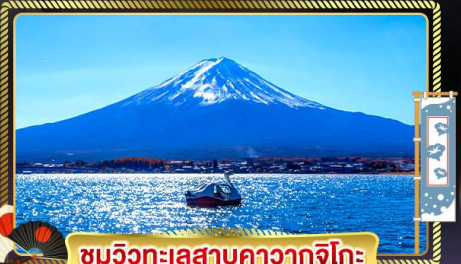
ชมวิวกะเลสาคาวากุจิโกะ