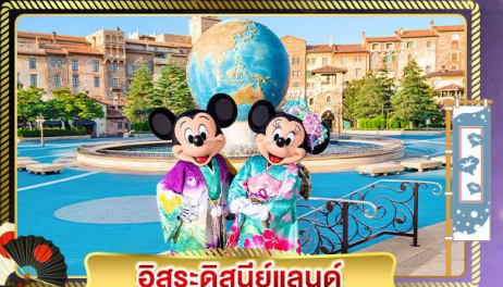
อิสระดิสนีย์แลนด์